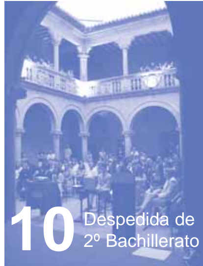
Despedida de 2º Bachillerato