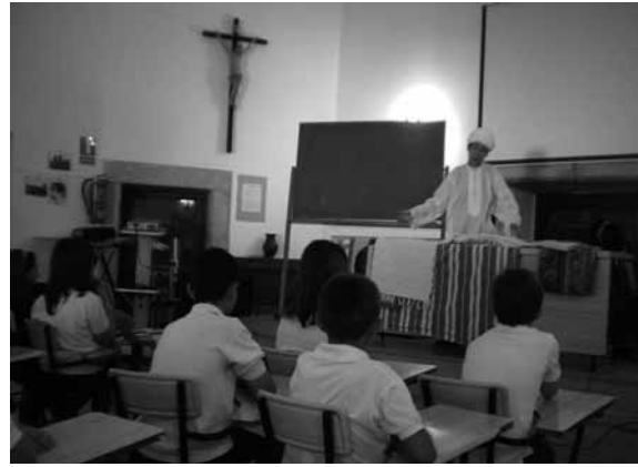
Animación a la lectura: cuentacuentos.